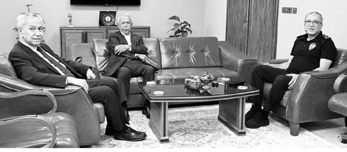
MANİSA ve Türkiye siyasetinin önemli isimlerinden, 22.