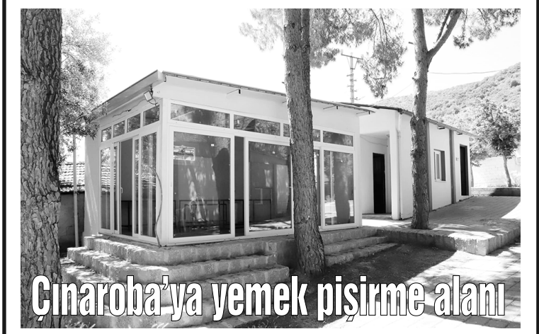
Çınaroba'ya yemek pişirme alanı

SARUHANLI Belediyesi, Çınaroba Mahallesi Sosyal Tesisleri bünyesinde düğün, cemiyet ve benzeri organizasyonlarda kullanılmak üzere yemek pişirme alanı oluşturdu. Yeni hizmetin mahalle sakinlerinin sosyal ihtiyaçlarına önemli katkı sağlaması hedefleniyor. Saruhanlı Belediyesi, ilçedeki sosyal yaşamı güçlendirmeye yönelik yatırımlarına devam ediyor. Bu kapsamda Çınaroba Mahallesi Sosyal Tesisleri içerisinde vatandaşların toplu organizasyonlarda kullanabileceği yeni bir yemek pişirme alanı kazandırıldı. Mahalle sakinlerinin düğün, hayır, cemiyet ve benzeri etkinliklerini daha sağlıklı ve düzenli şartlarda gerçekleştirebilmeleri amacıyla hayata geçirilen hizmet, vatandaşlardan da olumlu geri dönüş aldı.