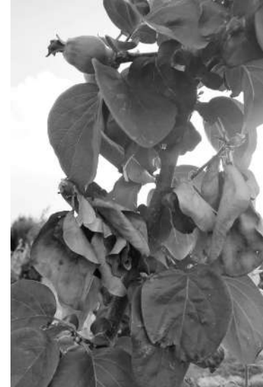
ELMA İÇ KURDUYLA MÜCADELE İHMAL EDİLMEMELİ

Kayı, badem, erik, şeftali ve kiraz ağaçlarında görülen yaprak delen hastalığının yayılımını önlemek amacıyla üreticilerin düzenli kontrol yapması ve gerekli ilaçlamaları ihmal etmemesi istendi. Yumuşak çekirdekli meyve ağaçlarında ateş yanıklığına karşı mücadele çağrısı yapıldı. Ayın, armut ve elma ağaçlarında görülen ateş yanıklığı hastalığının, ağaçlarda ciddi zarara yol açabileceği belirtilerek, hastalığın yayılmasını önlemek için zamanında müdahale edilmesi gerektiği ifade edildi.