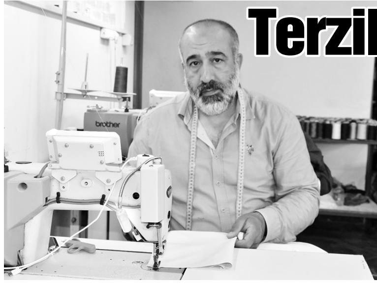
MANİSA'DA uzun yıllardır terzi mesleğini sürdüren Terzi