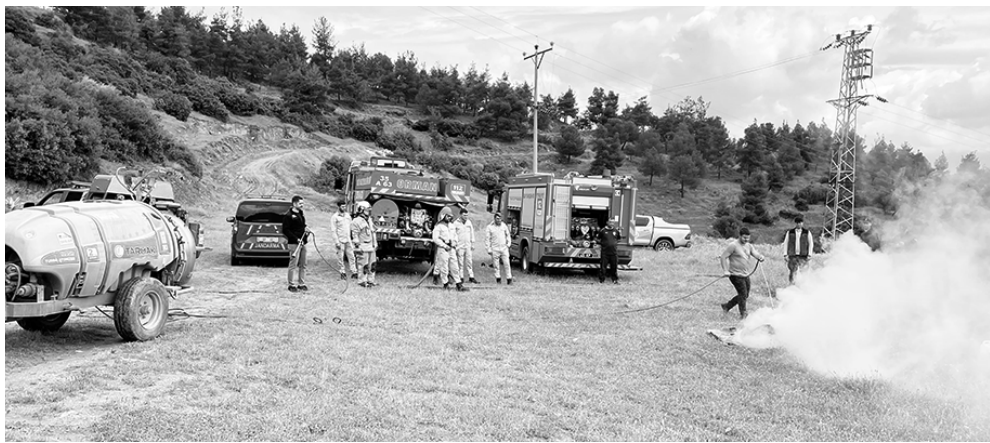
MANİSA'DA orman yangınlarına karşı hazırlıklı olunması amacıyla Valilik koordinasyonunda tüm ilçe-