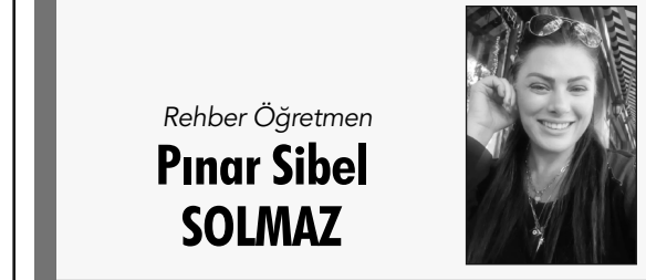
Rehber Öğretmen Pınar Sibel SOLMAZ