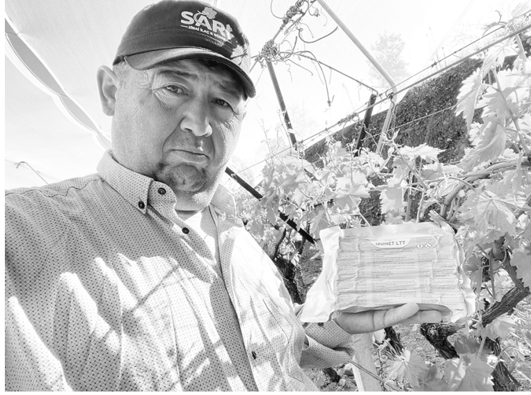
MANİSA'NIN Sarıgöl ilçesinde dünyaca ünlü Sultaniye