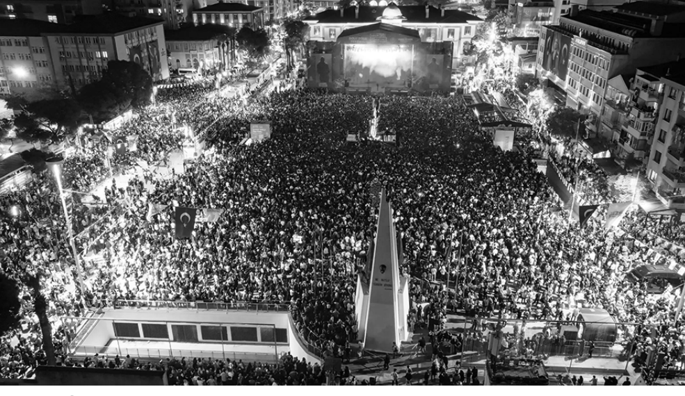
MANİSA 486. Uluslararası Mesir Macunu Festivali kapsamında sahne alacak sanatçıların konserleri Şanlıurfa ve Kahramanmaraş'taki saldırılar nedeniyle ertelendi.

Manisa'da bu yıl 486'ncısı düzenlenen Uluslararası Mesir Macunu Festivali kapsamında planlanan halk konserlerinin, yaşanan acı olaylar nedeniyle ileri bir tarihte ertelendiği bildirildi. Manisa Büyükşehir Belediyesi tarafından yapılan kamuoyu duyurusunda, Şanlıurfa ve Kahramanmaraş'ta öğretmen ve öğrencilerin hayatını kaybettiği saldırıların ardından konser programlarının ertelendiği belirtilerek, söz konusu etkinliklerin 19 Mayıs Gençlik Haftası kapsamında gerçekleştirilmesinin planlandığı ifade edildi. Festival kapsamında sahne alması beklenen Zeynep Bastık, Simge, Kibar ve Duman'ın konserlerinin de bu kapsamda ileri bir tarihte düzenleneceği öğrenildi.