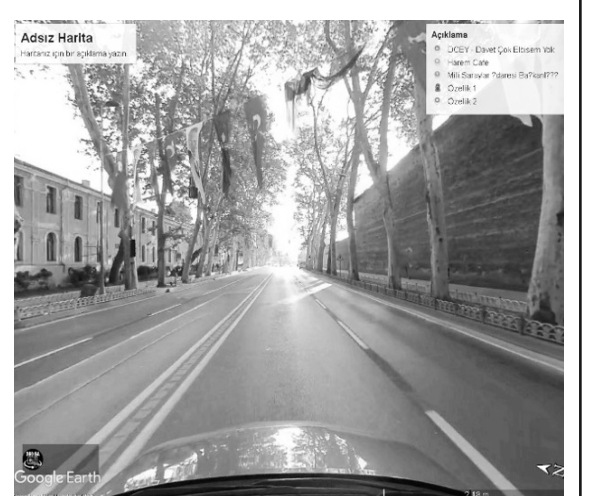
İSTANBUL DOLMABAĞÇE CADDESİ ÇINARLARI