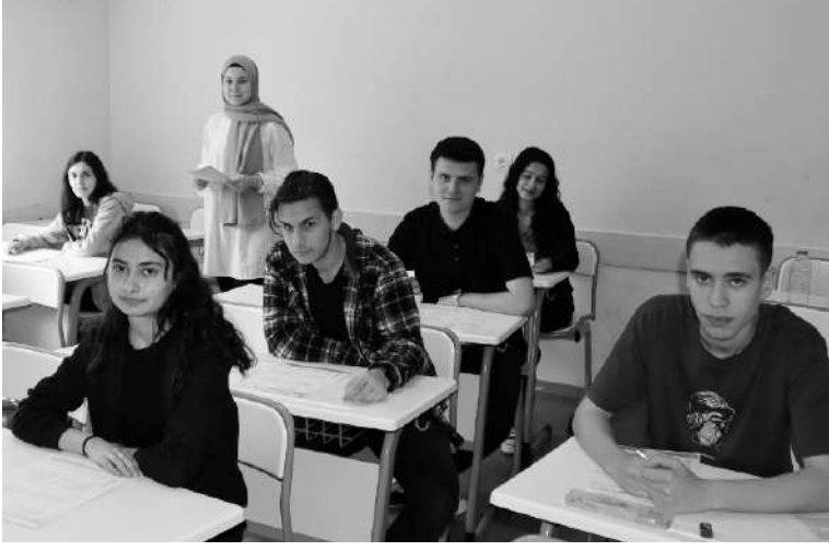
YUNUSEMRE Belediyesi Gençlik Eğitim Merkezi'nde