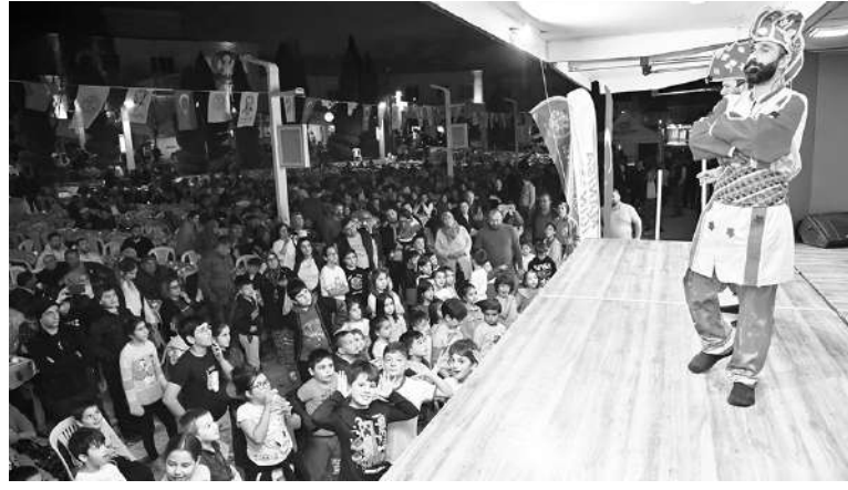
MANİSA Büyükşehir Belediyesi, Ramazan ayının birlik ve

Bu tür organizasyonları bundan sonra ilçemize yapılacak çeşitli hizmetlerin açılışlarında da görmek istiyoruz" dedi. İHA