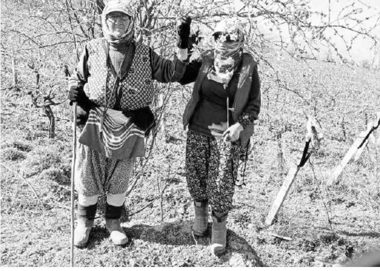
MANISA'NIN Sarıgöl ilçesi ve çevresinde üzüm bağlarında

kışık bakımları yapan tarım işçileri bahar havasında çalışma-