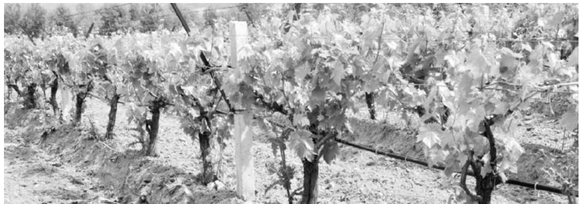
● Didem ALTINAY

TARIM ve Orman Bakanlığı, bitkisel üretimde kaliteyi artırmak ve gıda güvenliğini sağlamak amacıyla "Kalıntı Eylem Planı" çalışmalarını sürdürüyor. 2024 yılı itibarıyla Manisa, üzüm üretimi ile bu plan kapsamına alındı. Bu