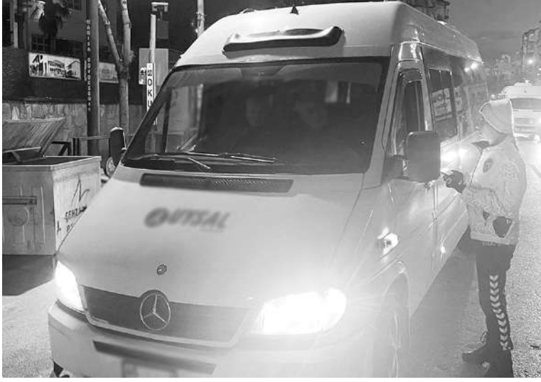
MANİSA İl Emniyet Müdürlüğü trafik ekipleri tarafından il genelinde okul servis araçlarına yönelik yapılan denetimlerde

14 araç ve sürücüsüne 39 bin 760 TL idari para cezası uygulandı. 1 okul servisinin de trafikten men edildiği bildirildi.