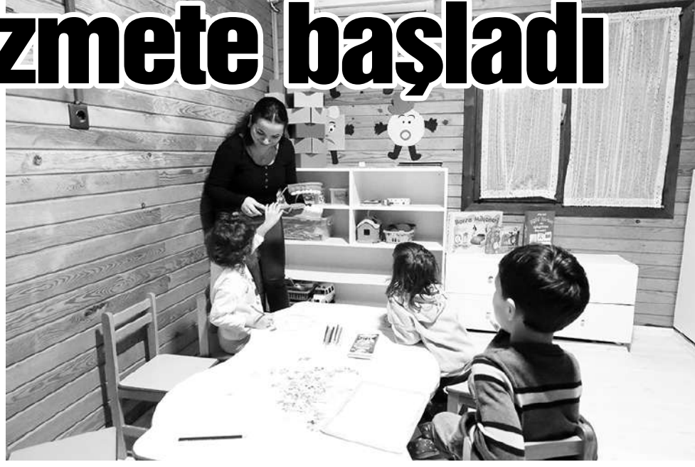
martesi günleri saat 19.00-23.00 saatleri arasında ebeveynler artık çocuklarını güvenle bırakabilecekleri bir merkeze kavuştu. Haber merkezi