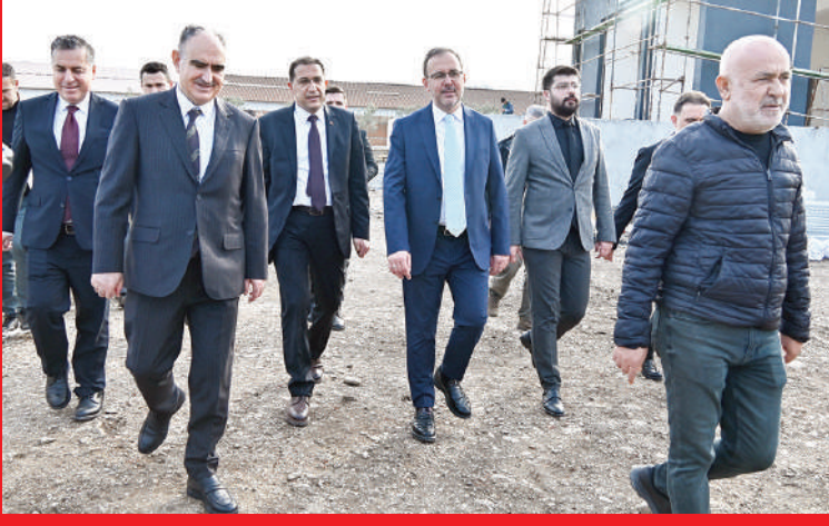
AK PARTİ İzmir Milletvekili Mehmet Muharrem Kasapoğlu, Manisa'nın Turgutlu ilçesinde spor tesislerinde ince-