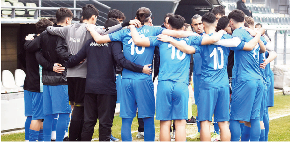
MANISA Futbol Kulübü U17 Takımı, Gelişim Ligleri Elit Ligi 22. hafta mücadelesinde

sahasında ağırladığı Fenerbahçe U17 Takımı'na 2-1 mağlup oldu.