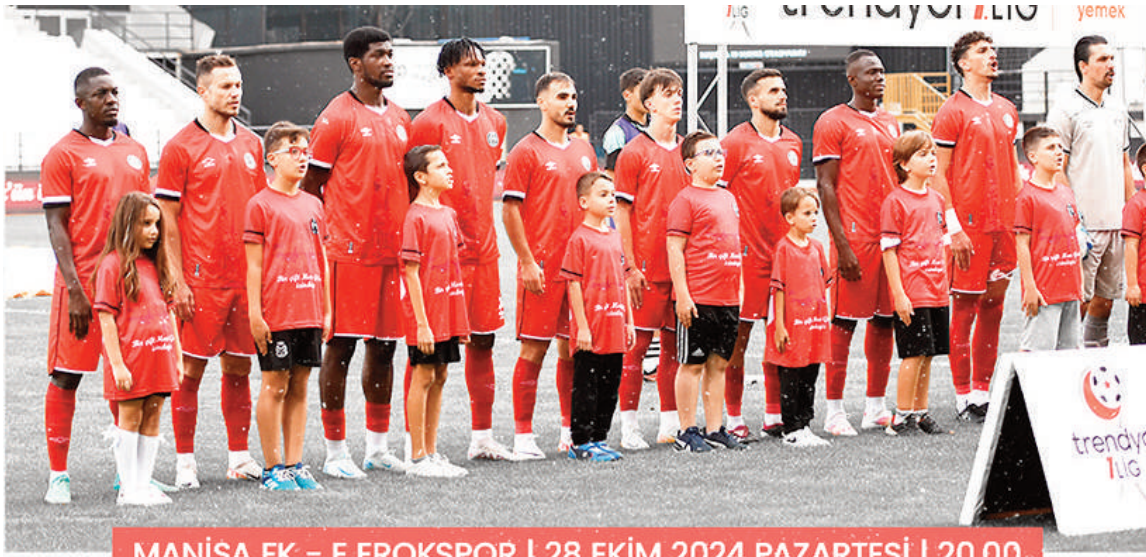
MANİSA FK - E.EROKSPOR | 28 EKİM 2024 PAZARTESİ | 20.00

yeceği formalar da günün anısına hediye edilecek.