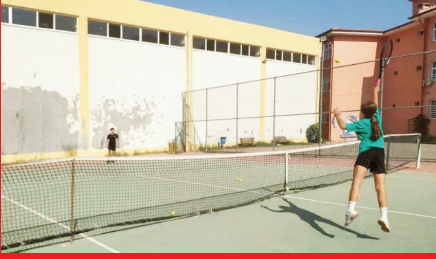
GENÇLİK ve Spor Bakanlığı (GSB) tarafından hayata geçirilen