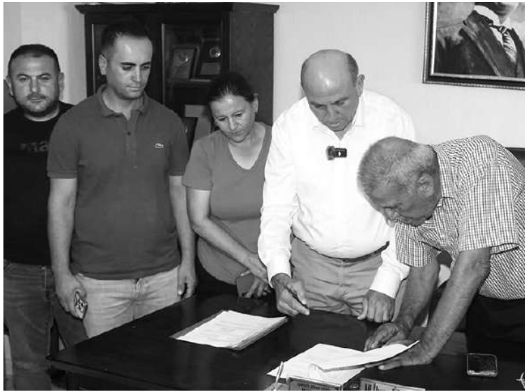
MANISA'NIN Sarıgöl Belediyesi ile Sarıgöl Ziraat Odası

Başkanlığı arasında sokak hayvanlarına barınak yapılması için protokol imzalandı.