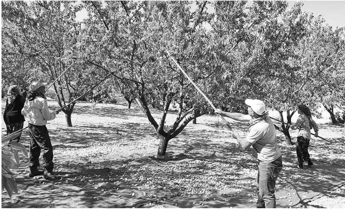
MANISA'NIN Demirci ilçesinde 550 ton badem rekoltesi bekleniyor. Hünnap, kiraz ve cevizin yanında son yıllarda

badem üretiminin arttığı Demirci'de çiftçiler badem hasadına başladı.