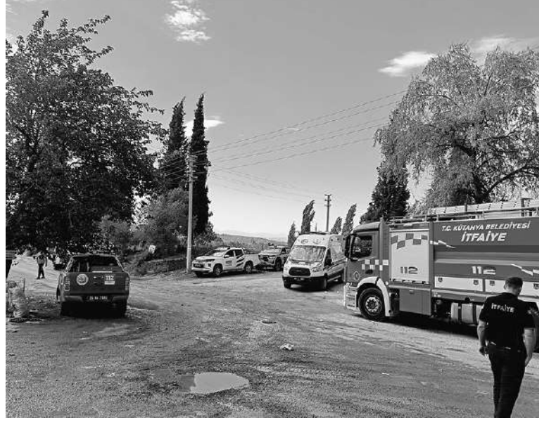
MANİSA'NIN Soma ilçesinde dün öğle saatlerinden bu yana devam eden yangın büyük ölçüde kontrol altına

alındı. Öte yandan sabahın ilk ışıklarına kadar yangının söndürülmesi için yoğun mesai harcayan Orman İşletme Müdürlüğü personelinin yorgunluktan bitap düştüğüne dikkat çekildi.