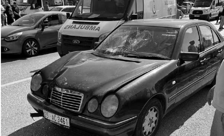
MANİSA'NIN Kula ilçesinde karayolunda yolun karşısına geçmek isteyen genç kıza 88 yaşındaki sürücünün kullandığı