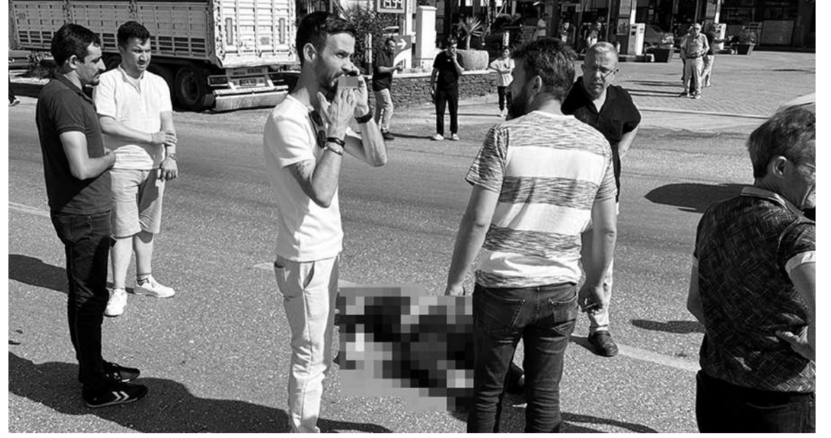
etkisiyle yaklaşık 50 metre savrulan genç kız, 112 acil servis ekiplerinin olay yerine yaptığı ilk müdahalenin ardından Kula Devlet Hastanesi'ne kaldırıldı. Genç kız, burada yapılan tüm müdahalelere rağmen kurtarılamadı. Kaza ile ilgili soruşturma başlatıldı.