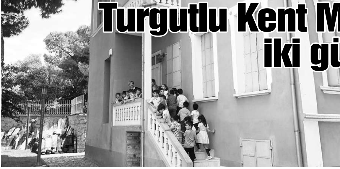
TURGUTLU Belediyesinin tarihe açılan yüzü olan Turgutlu Kent Müzesi, 9 günlük kurban bayramı tatilinde iki

gün ziyaret açık olacak. Müze, 21 Haziran Cuma ve 22 Haziran Cumartesi günleri ziyarete edilebilecek. Turgutlu Beledi-