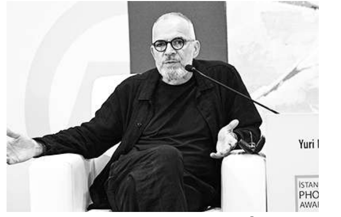
Foto muhabiri Yuri Kozyrev, İstanbul Photo Awards Talks'a konuk oldu

İSTANBUL Photo Awards jüri üyesi Yuri Kozyrev, usta fotoğrafçıların tecrübelerini aktardığı "İstanbul Photo Awards Talks" etkinliğine katıldı.