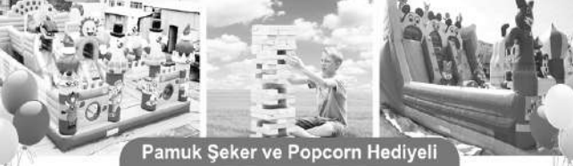
Pamuk Şeker ve Popcorn Hediyeli

23 NİSAN ULUSAL EGEMENLİK ve ÇOCUK BAYRAMI