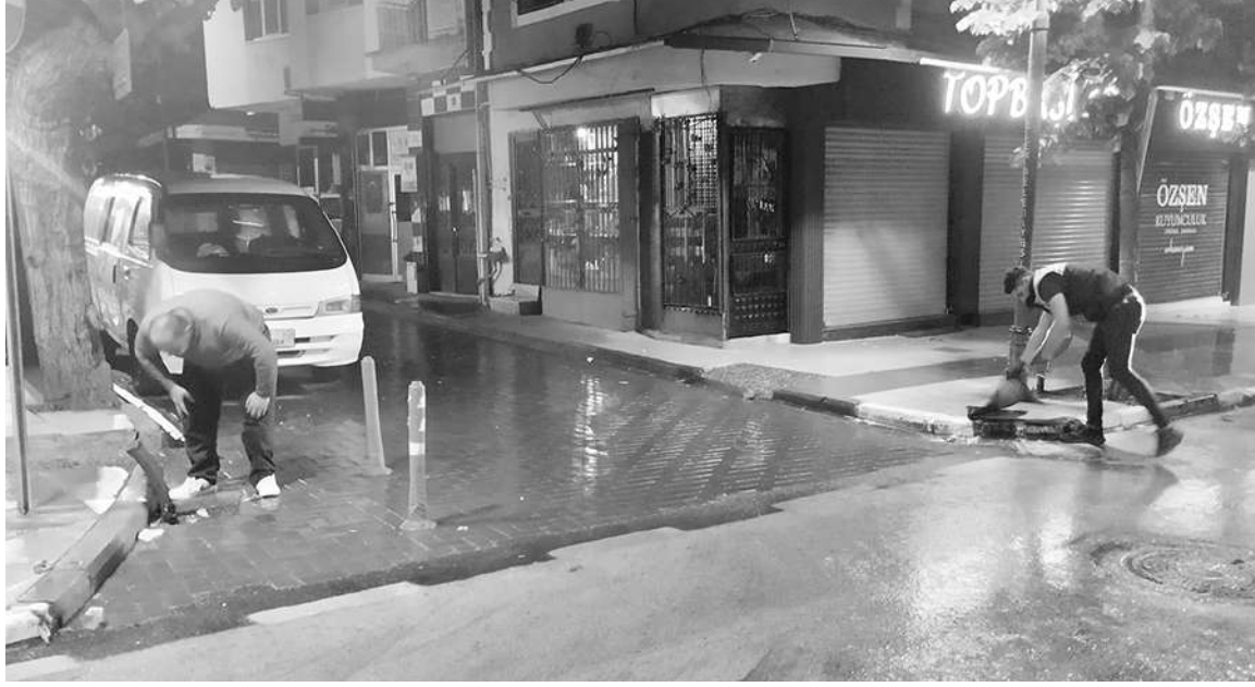
METEOROLOJİ Genel Müdürlüğü tarafından yapılan

sağanak yağış ve fırtına uyarısı sonrasında MASKİ Genel