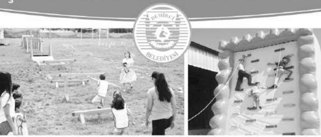
Başlama Saati: Resmi Kutlama Törenlerinin Hemen Ardından