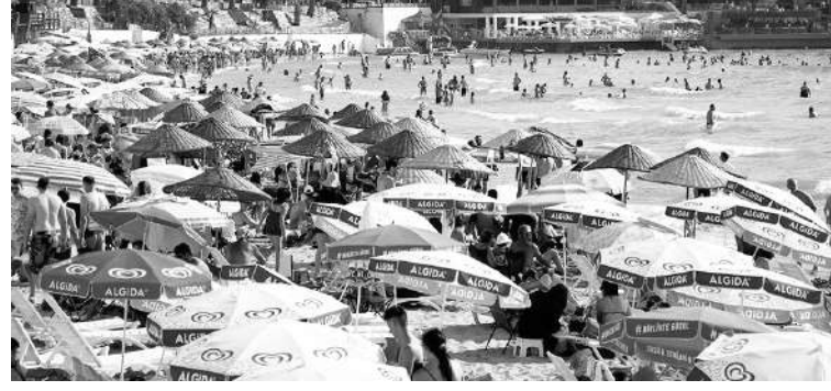
TÜRKİYE'NİN en sıcak illeri arasında yer alan Aydın'ın ka-

vurucu sıcakları ilin ekonomisini canlandırıyor. Ekonomik durumu iyi olanlar Aydın'ın kıyı kesimlerine bronzlaşmaya gelirken, ülkenin çeşitli illerinde yaşayıp yakını Aydın'da olanlar ise yazın kıyık yiyeceğini hazırlamak için Aydın'a geliyor.