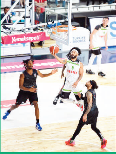
MANİSA Büyükşehir Belediyesi- por Basketbol Takımının FIBA Europe Cup'ta ön elemelerde Manisa'da ağırla-

yacağı rakipler belli oldu. Almanya'nın Münih kentinde yapılan kura çekiminin ardından Potanın Tarzanları, B grubunda Portekiz'den FC Porto, Litvanya'dan Neveşis Optibet'le aynı grupta yer aldı.