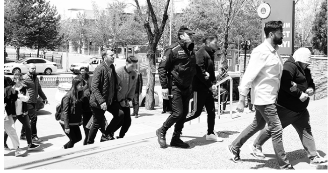
dolandırıcılık operasyonunda; Erzurum merkezli

TÜRKİYE genelinde 61 vatandaşın yaklaşık 5 milyon TL'sini dolandırma yoluyla gasp eden çete mensuplarından 9'u, çıkarıldıkları Erzurum Adliyesinde mahkemece tutuklandı. Erzurum Cumhuriyet Başsavcılığı koordinasyonunda, Erzurum Emniyet Müdürlüğü Asayiş Şube Müdürlüğü tarafından başlatılan