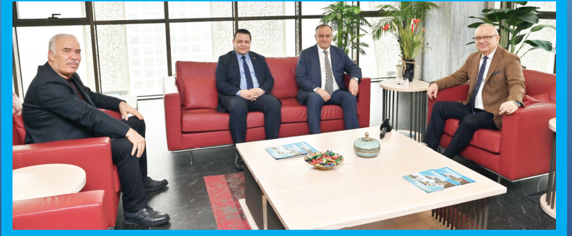
Manisa Büyükşehir Belediye Başkanı Cengiz Ergün, Milliyetçi Hareket Partisi Grup Başkanvekili ve Manisa Milletvekili Erkan Akçay ile İl Başkanı Cüneyt Tosuner'i makamında konuk etti

Ertürk ortak bir açıklama yaparak şöyle denildi: "Onurlu mücadelemizin sonunda demokrasi galip gelecek, bu mücadelenin kazananı halkımız olacaktır! Cumhurbaşkanı adayı ile ilgili içimizde hiçbir şüphe olmadığını vurguluyoruz." 4'te