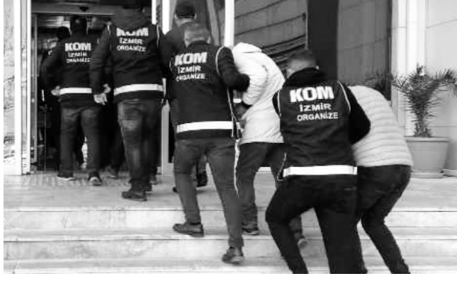
lanmasını tespit etti. Liderliğini K.A.'nın yaptığı suç örgütünü çökert-

öğrenildi. İzmir İl Emniyet Müdürlüğü Organize Suçlarla Mücadele Şube Müdürlüğü ekipleri, özellikle ihaleye fesat karıştırma suçu başta olmak üzere; mağdur edilen şahıslara yönelik silahlı tehdit ve şiddet uygulayan, nitelikli yağma ve şantaj yapan, kasten yaralama suçu işleyen, örgüt bünyesinde açık veya gizli iş bölümü bulunan, hiyerarşik yapıya sahip, aile tipi mafya yapı-