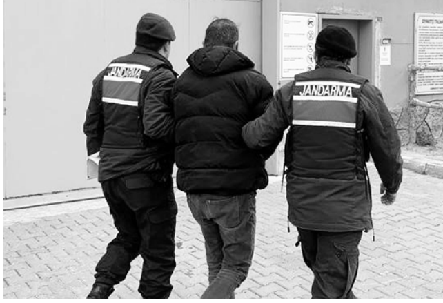
landı. 'Herkesin girebileceği yerde bırakılmakla

MANISA İl Jandarma Komutanlığı Jandarma Suç Araştırma Timi (JASAT) ekipleri tarafından, kesinleşmiş hapis cezası bulunan ve aranan şahıslara yönelik yapılan çalışmada 9 kişi yakalanarak adli makamlara sevk edildi. Manisa JASAT tarafından, 29 Mart günü il genelinde yapılan çalışmalar sonucunda toplam 9 şahsın yakalanarak adli makamlara sevk edildiği açık-