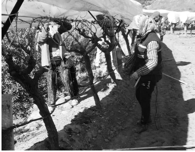
SARIGÖL ilçesinin Dadağlı Mahallesi'nde bulunan üzüm bağlarında

koruma maksatlı örtü çalışmalarının başladığı belirtilen Dadağlı Mahallesi